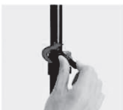
Stegnite u smeru kazaljke na satu