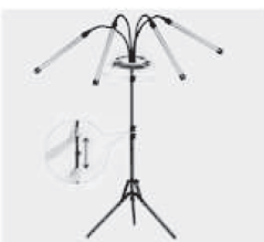
Podesite prema potrebi